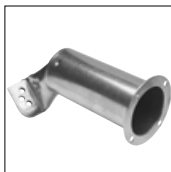
Art.-Nr. 12910P2 Überlappschweißdüse, 40 mm Zur Umrüstung der Schweißbreite