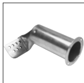
Art.-Nr. 1117P2 Überlappschweißdüse, 45 mm Zur Umrüstung der Schweißbreite