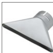
Art.-Nr. 4022 Breitschlitzdüse 150 x 10, für Typ 3000, 3000E