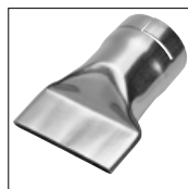
Art.-Nr. 4031 Breitschlitz- Aufsteckdüse 70 x 4