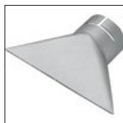
Art.-Nr. 4021 Breitschlitzdüse 150 x 1, für Typ 3000, 3000E