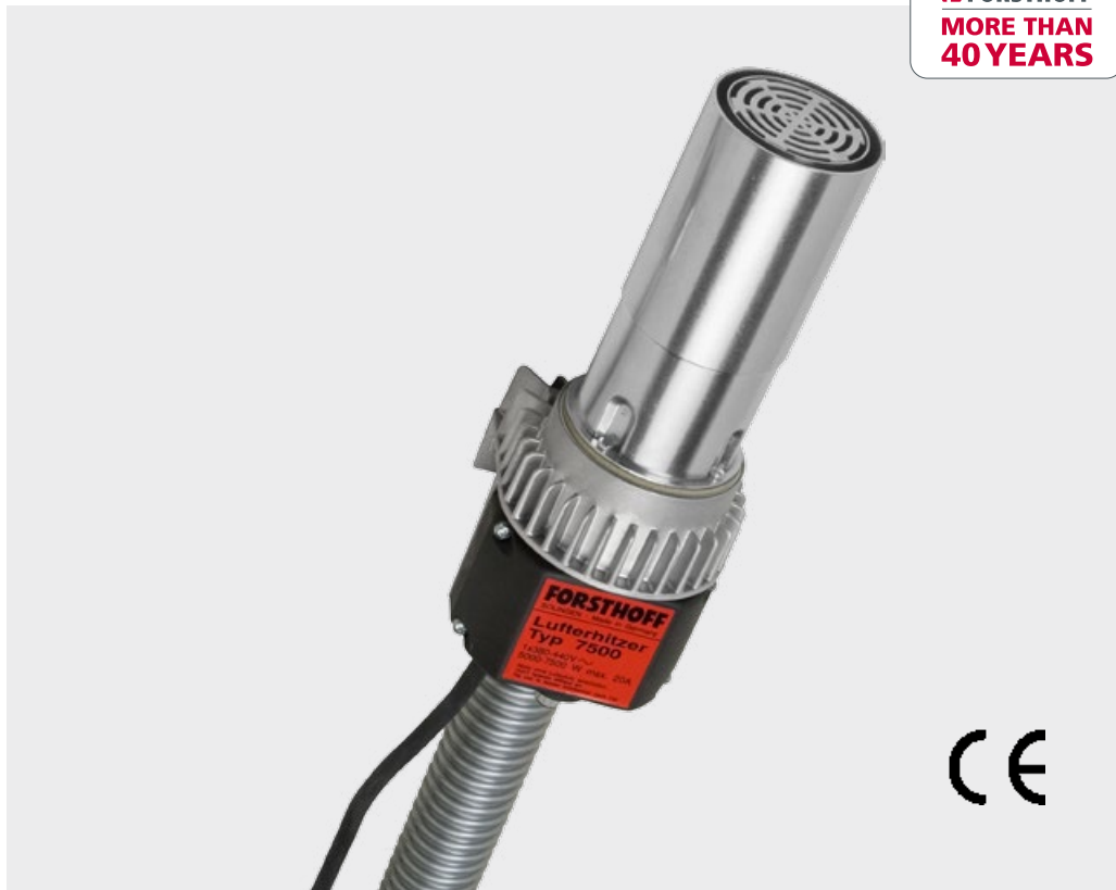
FORSTHOFF Luftheritzer Typ 7500

Das „Flagschiff“ unserer Luftheritzer-Flotte.