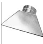
Art.-Nr. 4023 Breitschlitzdüse 200 x 5, für Typ 7500